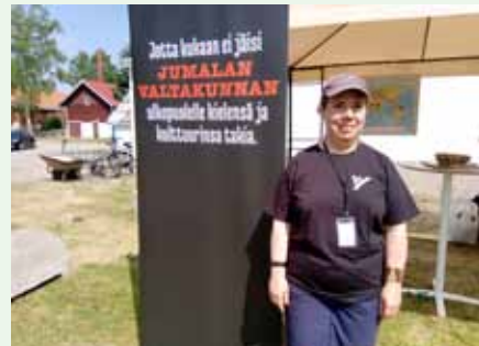
Wycliffe Raamatunkääntäjien esittelypiste Kansanlähetytpäivillä.

Etiopiassa edistyy. Syyskuussa oli vuorossa Tessalonikalaiskirjeiden konsulttitarkastus. Kiitos rukouksista ja muusta tuesta. Siuntau loppuvuotta!