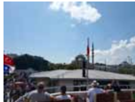
Elokuun helteessä, laivan kannelta otettu kuva, Istanbulin Euroopanpuolta.

”... hän myös rukoilee meidän edestämme.” - Room. 8:34