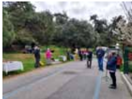
Istanbulin edustan saaritapahtuma, jaetaan kristillistä materiaalia