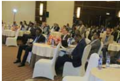
SIL Etiopiassa -järjestön 50-vuotisjuhla.