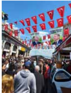
Vaalihuumaa toukokuun vaalien edellä