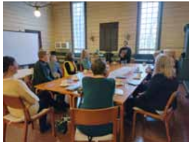
Kirjallisuuspöytä Tervakoskella.