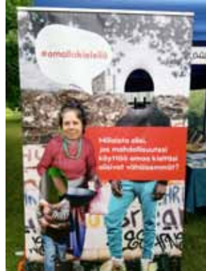
Raamatunkäännöstyön esittelypisteellä Kansanlähetyspäivillä pohdittiin mm. äidinkielen merkitystä.