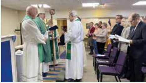
Lasnamäen pappien virkaansiunaaminen 17.11.2024.